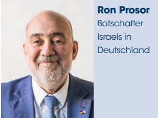
Ron Prosor Botschafter Israels in Deutschland